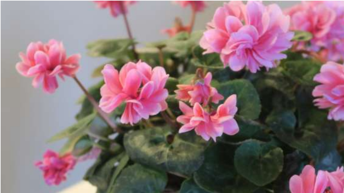
Cyclamen 'Masako' fra Schoneveld Breeding blev kåret som Årets Nyhed i potteplantekategorien.

Det var den smukke, mørklilla Lisianthus 'Black Pearl', der er forædlet af Sakata, der tiltrak sig opmærksomheden.