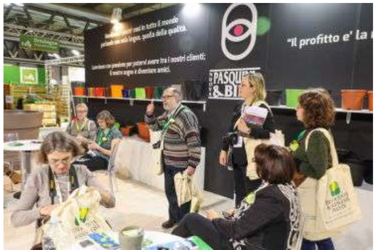
Стенд Nuova Pasquini & Bini