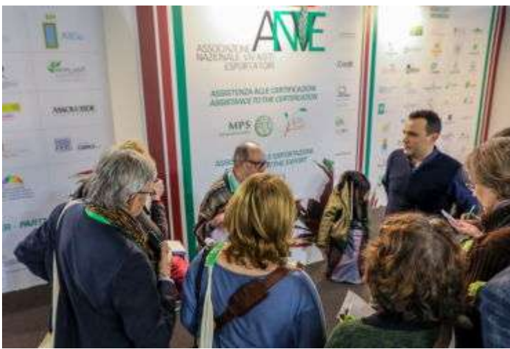
Стенд Ассоциации итальянских питомников