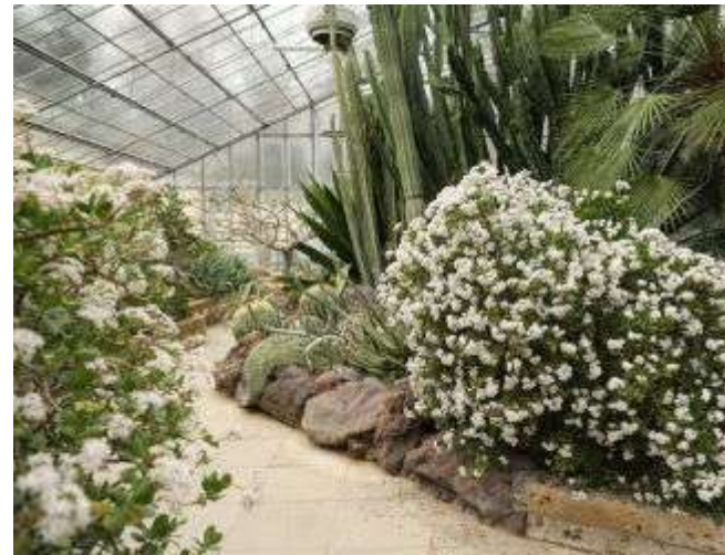
Аграрная школа Di Minorio