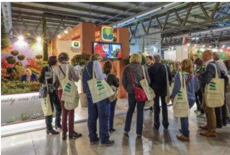
Стенд Innocenti & Mangoni

На стенде компании NIRP International, занимающейся производством роз, “плавала” белая лодка, наполненная этими роскошными ароматными цветами. Огромный выбор пластиковых контейнеров был представлен на стендах фирмы Nuova Pasquini & Bini, базирующейся вблизи г. Пистойя и компании IDeL. Этой семейной фирме исполнилось 60 лет, сменилось уже три поколения ее владельцев. Компания выпускает кашпо более 2500 наименований, из которых 60% идет на экспорт, в т.ч. и в Россию.