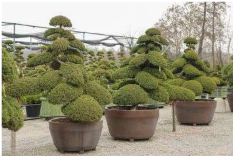
Питомник Nippon Tree

Питомник Nippon Tree продемонстрировал первоклассные ниваки (сосны, кипарисовики, тисы, азалии, падубы, энкиантусы и др.), закупаемые с корневым комом в Японии. Продаются также замечательные бамбуки (филлостахисы). Растения передерживают и отчасти доращивают на полях и контейнерных площадках общей площадью всего 3 га. Продаются также инструмент и садовые стремянки из Японии. Рабочих в хозяйстве трудится всего 3 человека, в сезон - до 5 человек. По словам владелицы питомника Евы Форлани, в Японии все труднее становится выбирать хорошие ниваки, поскольку молодое поколение не склонно тратить годы и годы жизни на их выращивание, поэтому данному виду садовой культуры грозит опасность.