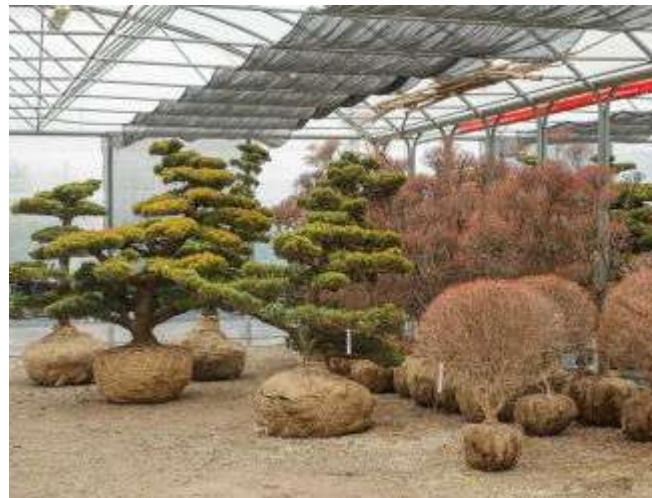
Питомник Nippon Tree

Еще один питомник - Vivai Nord Snc. Питомник возник около 30 лет назад, он занимается выращиванием зимостойких (для условий Центральной и Западной Европы) растений в регионе Комо, на площадях около 40 га (недавно заложены также площади и в г. Пистойя - 4 га). Ассортимент продукции большой: деревья разного размера, кустарники, розы, ацидофилы (азалии, эрики), хвойные, фруктовые культуры, стриженные формы - всего более 1500 видов и сортов растений. В хозяйстве стараются постоянно выводить на рынок новинки (сосна кедровая Sartori, яблоня Ballerina, граб Bonamoni, дзельква Sartori, повторно цветущие азалии серии Epcore) и др. Помимо посадочного материала, предлагают к продаже контейнеры, дренажные поливочные и фильтрационные системы, камень, семена, удобрения и инструменты для сада и питомника.