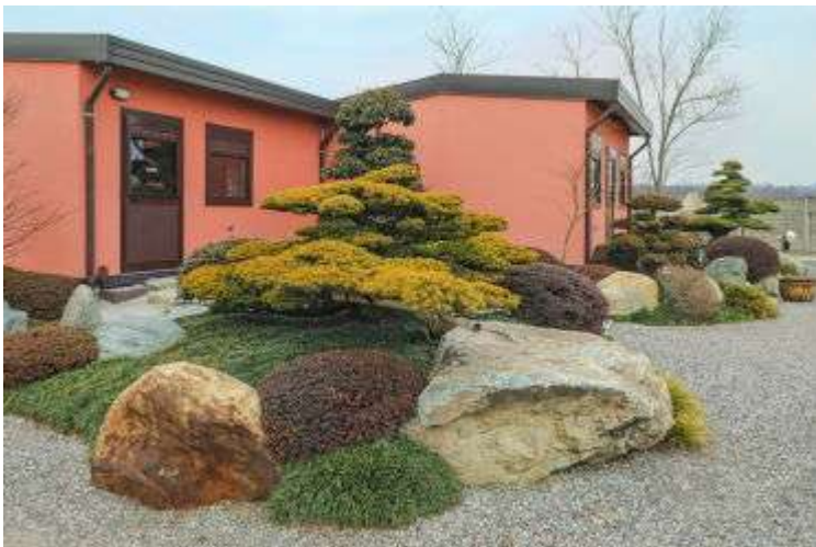
Питомник Nippon Tree