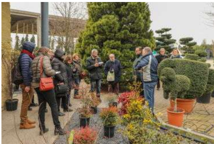
Питомник Vivai Nord

Еще один питомник - Vivai Nord Snc. Питомник возник около 30 лет назад, он занимается выращиванием зимостойких (для условий Центральной и Западной Европы) растений в регионе Комо, на площадях около 40 га (недавно заложены также площади и в г. Пистойя - 4 га). Ассортимент продукции большой: деревья разного размера, кустарники, розы, ацидофилы (азалии, эрики), хвойные, фруктовые культуры, стриженные формы - всего более 1500 видов и сортов растений. В хозяйстве стараются постоянно выводить на рынок новинки (сосна кедровая Sartori, яблоня Ballerina, граб Bonamoni, дзельква Sartori, повторно цветущие азалии серии Epcore) и др. Помимо посадочного материала, предлагают к продаже контейнеры, дренажные поливочные и фильтрационные системы, камень, семена, удобрения и инструменты для сада и питомника.