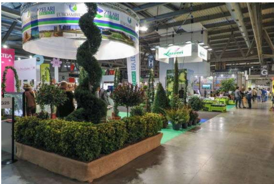
Стенд питомника Zelari

В Милане 22-24 февраля этого года прошла одна из крупнейших в Европе выставок декоративного и плодового растениеводства, садоводства и ландшафтного дизайна Myplant & Garden. В составе группы журналистов из европейских стран по приглашению итальянского журнала Lineaverde (Зеленая линия) мне посчастливилось поучаствовать в пресс-туре по залам и стендам этой яркой выставки и совершить ознакомительные визиты в несколько местных питомников.