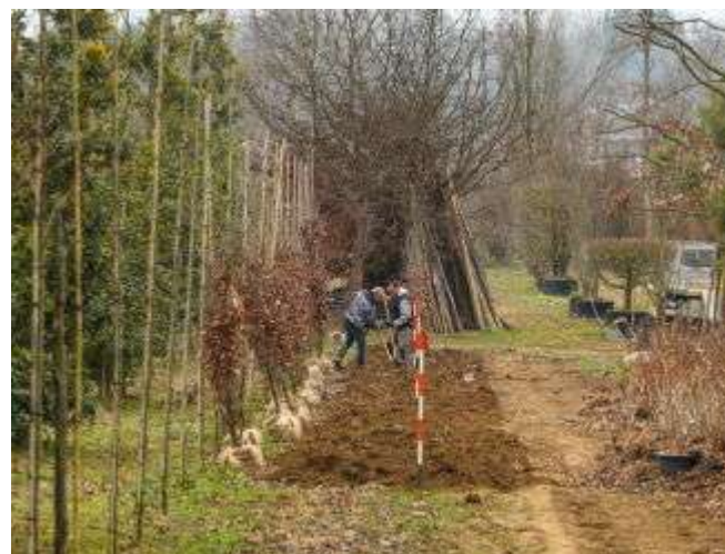
Питомник Cappellini piante

Стенд питомника Cappellini Giardinieri, представляющего внушительный растительный ассортимент, был оформлена оригинально и лаконично: длинная дощатая стойка, яркие постеры и живые растения. Стильным и минималистичным был и стенд компании Nippon Tree, поставляющей и выращивающей крупномерные формованные деревья - ниваки. Впрочем, в одном репортаже невозможно охватить весь спектр представленных на выставке компаний, которых, напомним, было более шести сотен.