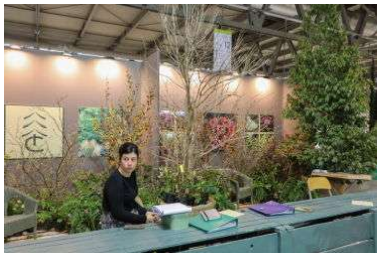
Стенд питомника Carpellini