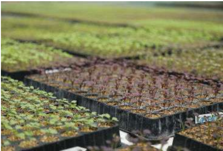
Аграрная школа Di Minorio