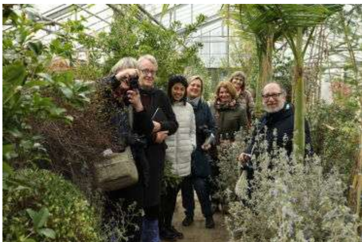
Питомник Cappellini piante

Питомник Coplant Vivai Piante выращивает главным образом теплолюбивые культуры: гибискусы, османтусы, падубы, лагерстремии, а также розы и вьющиеся растения - всего более 1000 разных культиваров на площади 100 га. В экспозиции питомника Vivai Nord нас ждало неожиданное угощение – крошечные сэндвичи с сыром и... цветами: маргаритками и фиалками. Компания на своих площадях выращивает большой спектр зимостойких (по меркам Италии) растений.