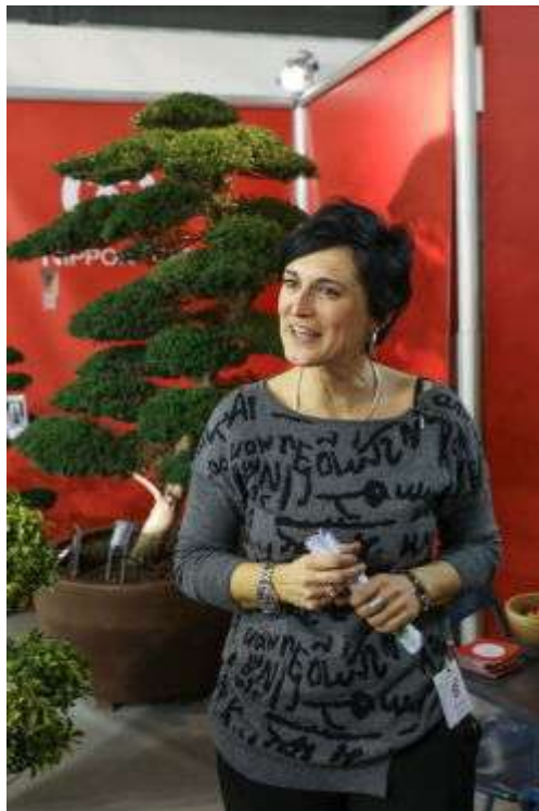
Стенд питомника Nippon Tree