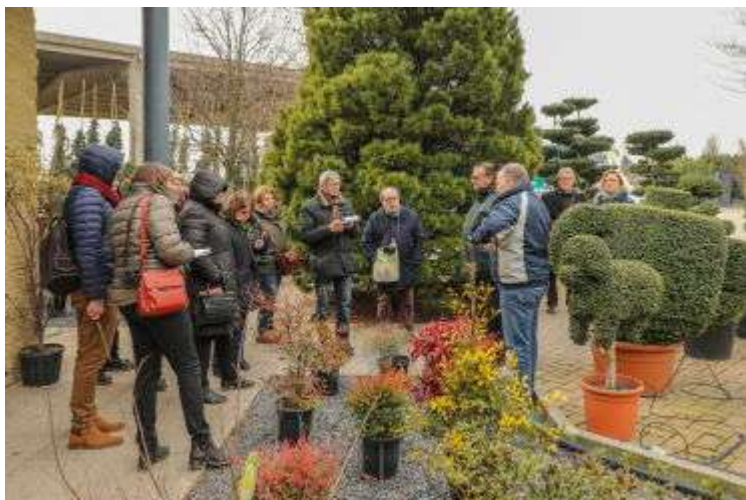
Питомник Vivai Nord

Большая и яркая экспозиция питомника Innocenti & Mangoni Piante была расположена почти напротив стенда питомника Zelari. Обе компании базируются в г. Пистойя, где на больших площадях выращивают большой ассортимент растений – от небольших контейнерных культур до огромных аллежных деревьев. Очень любопытной показалась экспозиция компании I Frutti Antichni di Enzo Maioli, где сохраняют и размножают старые, почти исчезнувшие сорта плодовых деревьев.