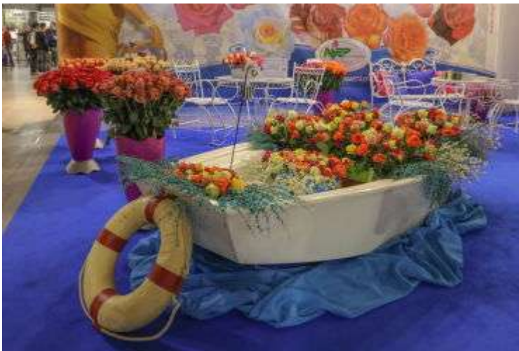
Стенд компании NIRP

Пресс-группа за время работы выставки посетила разные стенды: Ассоциации итальянских питомников – экспортеров, компании Vivai D'adda Gianpietro, которая выращивает крупномеры цитрусовых и оливковых деревьев. Два питомника этой компании расположены в Испании (площадью 40 га) и в Италии (10 га). Экспозиция фирмы Cactusmania приводила в восторг любого любителя суккулентов. Она выпускает большое количество кактусов и других засухоустойчивых растений, имеет специализированные садовые центры, специалисты компании создают также живые композиции для оформления интерьеров.