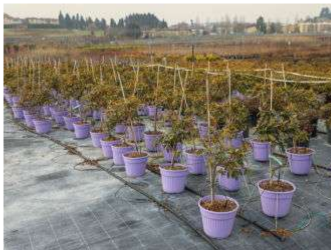
Питомник Vivai Nord

Питомник Coplant Vivai Piante выращивает главным образом теплолюбивые культуры: гибискусы, османтусы, падубы, лагерстремии, а также розы и вьющиеся растения - всего более 1000 разных культиваров на площади 100 га. В экспозиции питомника Vivai Nord нас ждало неожиданное угощение – крошечные сэндвичи с сыром и... цветами: маргаритками и фиалками. Компания на своих площадях выращивает большой спектр зимостойких (по меркам Италии) растений.