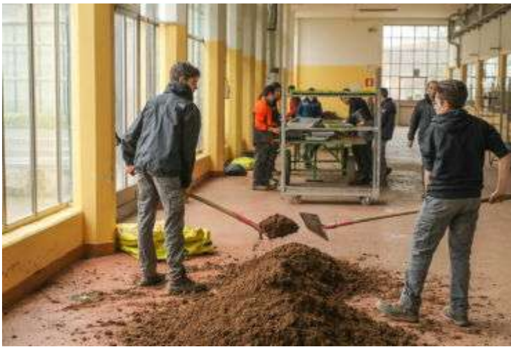
Аграрная школа Di Minorio