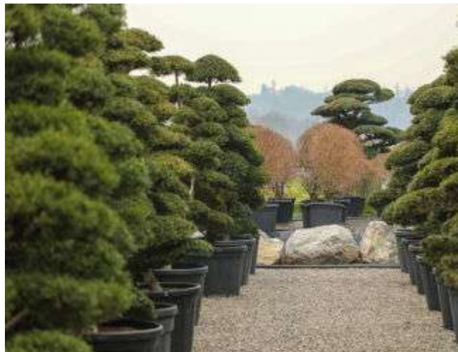
Питомник Nippon Tree

В рамках программы выставки проводился конкурс “Витрина Превосходства - Myplantgarden 2018” под председательством президента жюри, синьора Ренато Ферретти (Renato Feretti). На конкурсе были представлены новинки в разных категориях садовой продукции. Награды получили новая травосмесь для формирования дерна, стойкого к засухе, эффективный биофунгицид на основе Tricoderma sp. , система подземного орошения Lite Soil, проницаемая и фильтрующая система для парковых дорожек Drena Lumi и другие образцы. В частности, в категории “Новые разновидности декоративных растений” победу одержал роскошный махровый цикламен “Masako” от голландского производителя – фирмы Schoneveld.