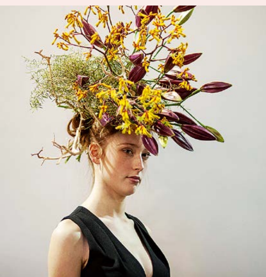
Fot. 1. Pokazy modowo-florystyczne były charakterystycznym elementem targów w Mediolanie

Trzeba jednocześnie przyznać, że Myplant & Garden, choć w pełnym tego słowa znaczeniu stał się już międzynarodową imprezą, dotychczas skupiał się na wewnętrznym, włoskim rynku.