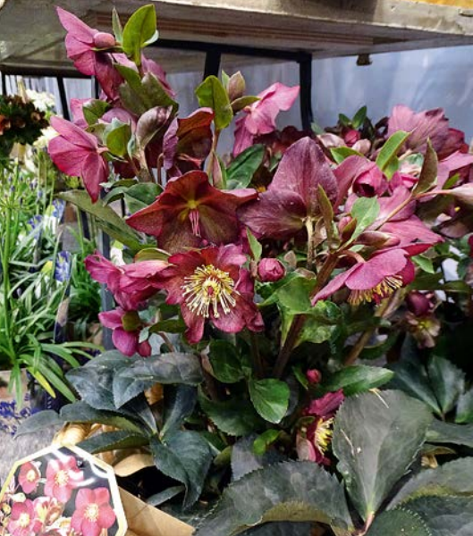
Fot. 15. Helleborus xglandorfensis HGC® Ice N' Roses 'Red'

z firmy Rosa Danica informuje, że trafiają głównie do Europy Wschodniej (Rosji) oraz Francji. Wspomina jednocześnie, że produkt „odkryto” przez przypadek, podczas prac dotyczących selekcjonowania nowych odmian róż doniczkowych, które na tym poligonie doświadczalnym uprawiano pojedynczo, w małych doniczkach.