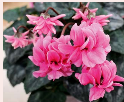
Fot. 4. Cyklamen ‘Masako’

Na tegorocznych targach nie zabrakło konkursu („Vetrina delle eccellenze”) i nagród dla wyróżniających się prezentacji. Jedną z nich przyznano za cyklamen ‘Masako’ – oryginalną, pełnokwiatową odmianę hodowli holenderskiej firmy Schoneveld Breeding (fot. 3, 4).