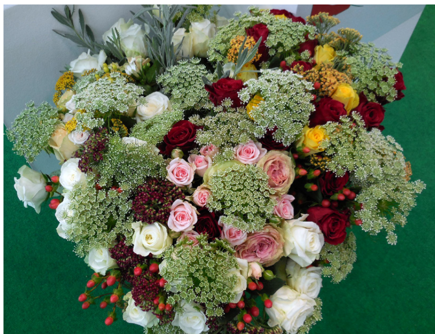
Il reciso continua ad avere un mercato con numeri importanti

Importanti le performance produttive vivaiistiche di Cina (oltre 9,1 mld di euro, oltre 800mila ha di coltivazioni) e Stati Uniti (5,9 mld di euro su 162mila ha). La produzione di fiori e piante ornamentali ha registrato in Centro-Sud America un valore di 3,1 mld di