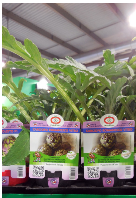
Non mancano le aziende orticole con assortimenti per ogni latitudine