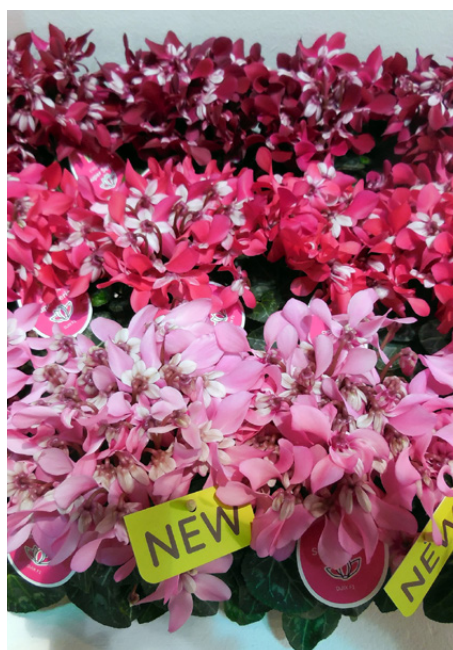
I grandi floricoltori internazionali presentano le novità per la stagione che verrà