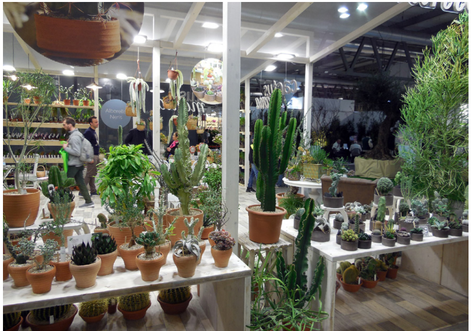
Negli stand di Myplant & Garden 2025 sarà in esposizione il meglio di ogni azienda