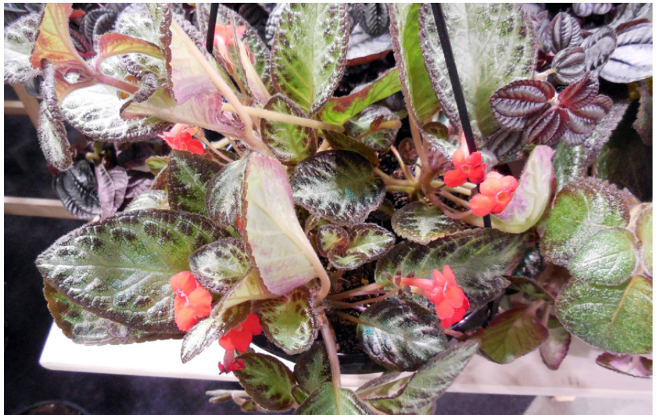
Episcia cupreata 'Silver Spring', una novità vista lo scorso anno

incontri con gli operatori del settore. Forte di un successo sempre crescente, MyplanTech è il percorso tra i padiglioni che individua i prodotti e le soluzioni innovative e sostenibili che stanno dando forma al futuro del settore florovivaistico. Infine, per venire incontro alla crescente richiesta di partecipazione ai mee-