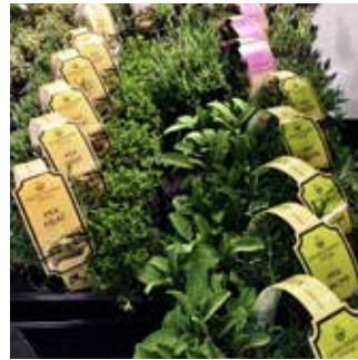
Pokazywano gotowe koncepcje sprzedażowe