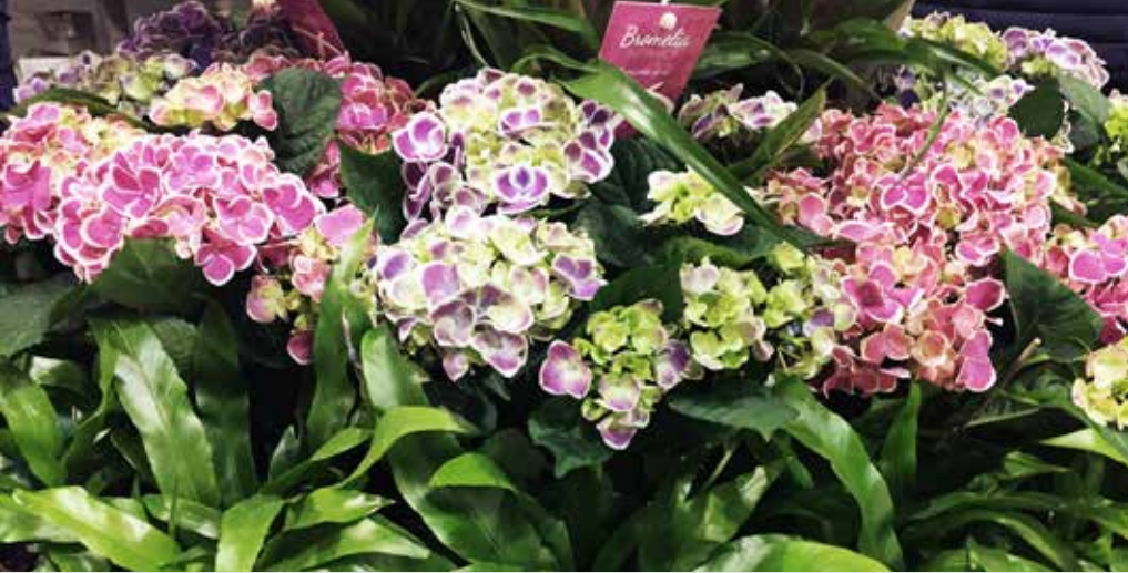
Piękne rośliny przykuwały uwagę zwiedzających

Podczas targów odbyło się także Flower Show, imponujące pokazy florystyczne.