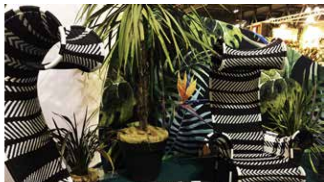
Targi były źródłem inspiracji do tworzenia ciekawych aranżacji