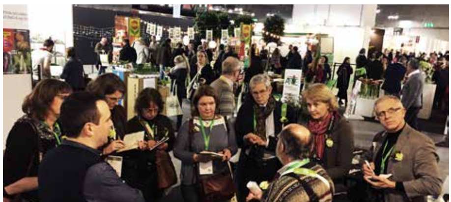
Podczas targów zorganizowano press tour

T egoroczna 4. już edycja Myplant & Garden International Green Expo – najważniejszych targów ogrodniczych B2B we Włoszech odbyła się w Fiera Milano Rho-Però w dniach 21-23 lutego. Na targi przyjechało ponad 17 tys. zwiedzających.