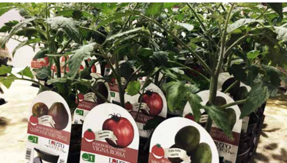
Bardzo ważne w sprzedaży są etykiety

Podczas 3 dni wystawy można było zobaczyć produkty w 8 sektorach wystawienniczych – szkółkarstwo, kwiaty cięte, dekoracje, architektura krajobrazu, maszyny, usługi, pielęgnacja ogrodu, doniczki. ■