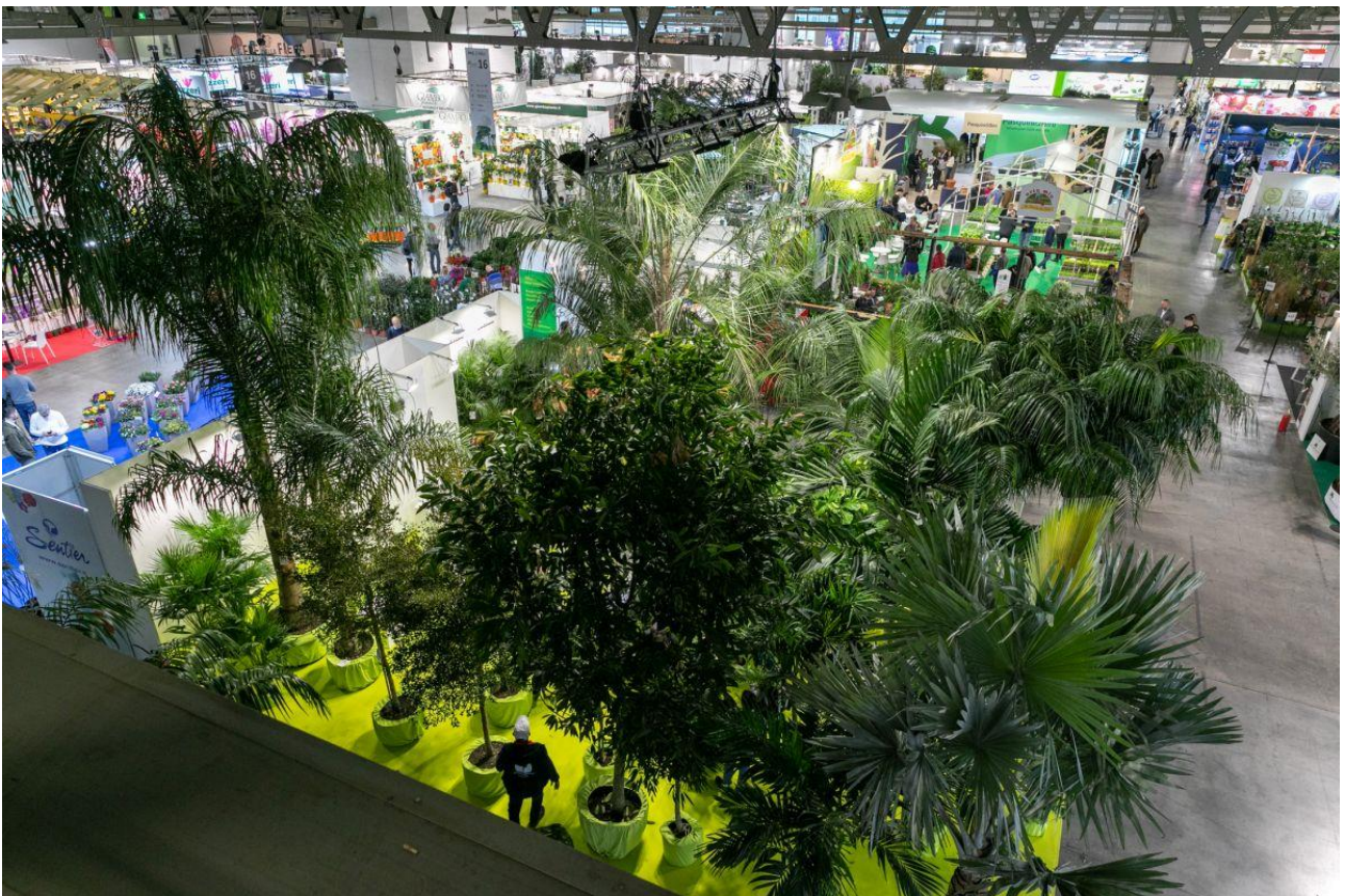
Myplant & Garden: Il Festival del Verde internazionale a Milano

La Toscana si conferma al vertice delle produzioni vivaistiche nazionali, occupando il 55% del mercato e generando un fatturato prossimo al miliardo di euro, registrando un aumento del +11,6%. La Liguria si conferma come una protagonista sempre più rilevante, con un volume di produzione di 435,6 milioni di euro (+11,7%), che rappresenta il 30% delle produzioni floricole a livello nazionale.