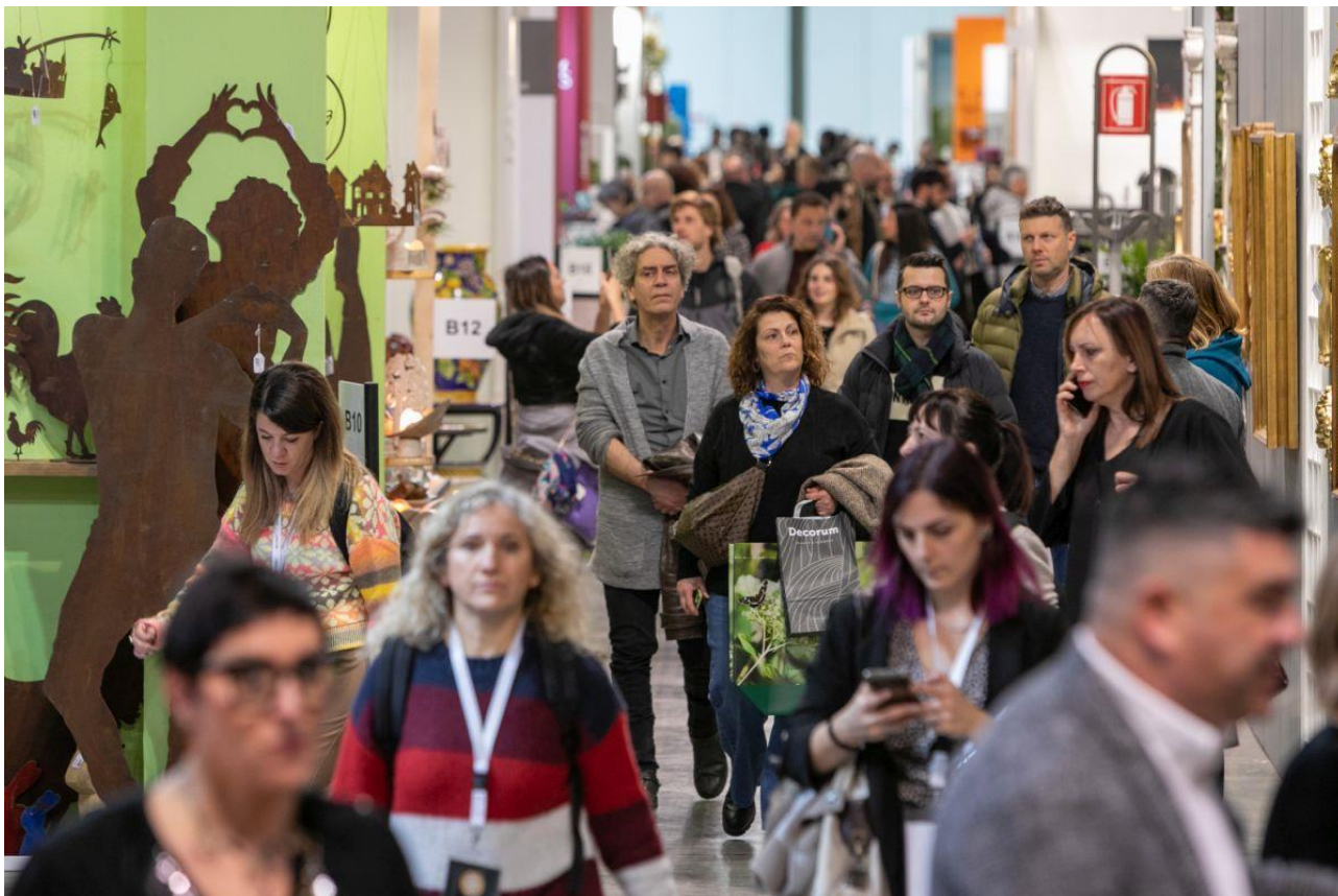
Myplant & Garden: Il Festival del Verde internazionale a Milano

"Green, sostenibile e smart: questo è il futuro che stiamo disegnando per le imprese, il comparto e il Paese" , affermano da Myplant & Garden, il Salone internazionale del Verde giunto alla VIII edizione, appuntamento professionale tra i più importanti al mondo