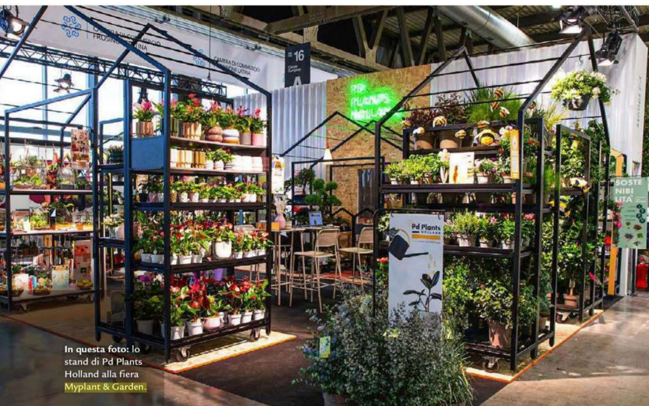
In questa foto: lo stand di Pd Plants Holland alla Fiera Myplant & Garden.

GUIDA ALL'ACQUISTO DI ELISABETTA CLEMENTEL E BENEDETTA MINOLITI