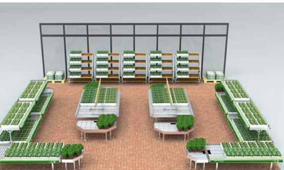
Organizzazione Orlandelli fornisce anche assistenza nella progettazione del layout. Nella foto un rendering per un reparto dedicato all'orticoltura.

arrivare anche da altri settori. Anzi io me lo aspetto a breve perché vedo aziende che si stanno già muovendo.