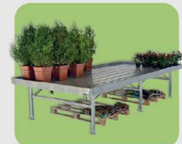
Bancale espositore in alluminio

La versatilità dei nostri prodotti vi aiuterà ad allestire il Garden Center, il vivaio o l'agraria, migliorando le performance di vendita.