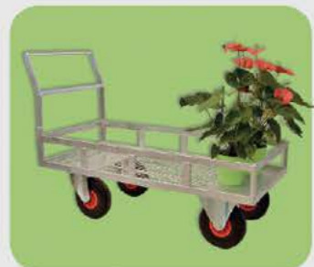
Carrello Vivaio e Garden