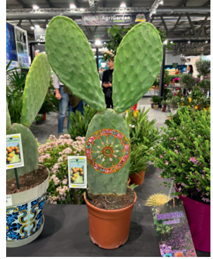
Opuncja na wesoło