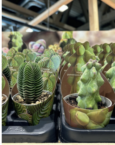
Nie brakowało ciekawych gatunków i odmian sukulentów (tu: Crassula 'Bhudda's Temple' oraz Myrtillocactus geometrizans 'Fukurokuryuzinboku' ) ze stoiska firmy Giromagi