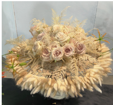
Jeden z bukietów wykonanych pod szyldem tej szkoły podczas pokazów florystycznych, które odbywały się w trakcie targów Myplant