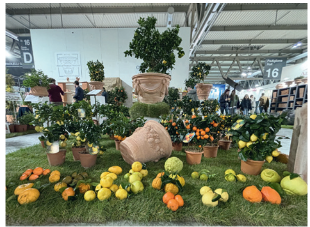
Gospodarstwo Vivai Oscar Tintori tak promowało rośliny cytrusowe ze swojej oferty i ich gatunkową różnorodność

rejonem produkcji roślin, takich jak: kaktusy i inne sukulenty (na kilku stoiskach specjalnie wyeksponowane), cytryny (i pokrewne im gatunki) w doniczkach o różnych rozmiarach, ziola, bugenwille – niekiedy bardzo okazałe,