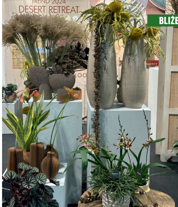
Trend dekoratorski Desert Retreat, czyli „pustynne zacisze” – wg BLOOM'S

Na przykład zaprezentowano linię pojemników z serii Tera włoskiej firmy Teraplast, która szczyci się tym, że produkuje doniczki wyłącznie z odpadów – przede wszystkim zużytego i ponownie poddanego obróbce plastiku. Niedawno