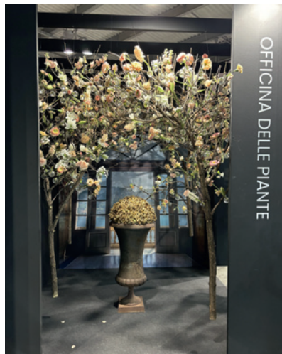
Officina Delle Piante również wabiła wzrok atrakcyjną, dopracowaną aranżacją