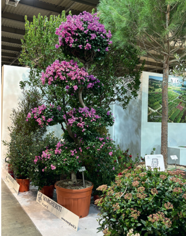
Okazła drzewkowata bugenwilla uformowana „na bonsai” wyróżniła ekspozycję firmy Mergheriti Piante