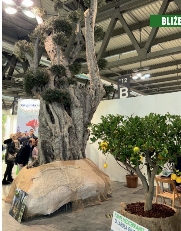
Wiekowa oliwka była dużą atrakcją stoiska firmy Piante Larosa Giuseppe

oliwki w pojemnikach (nawet wiekowe), kwitnące na żółto akacje ( Acacia dealbata ) – tzw. mimozy itp. Na imprezie otwierającej sezon wiosenny nie mogło też zabraknąć typowych roślin balkonowo-rabatowych, które są jego symbolem i jednym z kół zamachowych branży.