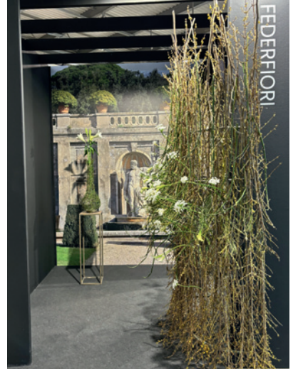
Kompozycja przestrzenna przygotowana przez stowarzyszenie włoskich florystów Federfiori zwracająca uwagę stylem i elegancją