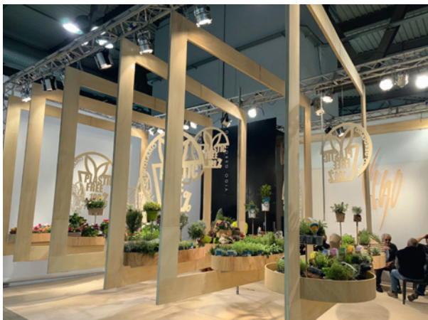
Gospodarstwo Vigo z Albengi promowało ekologiczne aspekty produkcji ziół, w tym fakt, że oferuje rośliny w doniczkach nieplastikowych oraz posługuje się paletami „plastic free”

Podobnie jak podczas poprzednich siedmiu edycji tych targów również w br. rzuciły się w oczy charakterystyczne produkty związane z lokalizacją imprezy, a zarazem