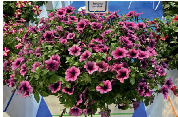
Petunia Sentunia Hot Pink – jedna z odmian hodowli Sentiera