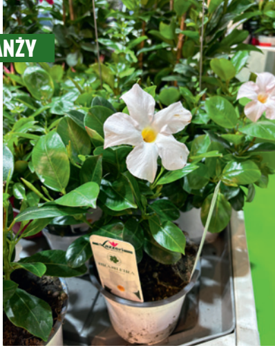
Mandevilla Brasileira Early Snow White – nowa odmiana hodowli firmy Lazzeri