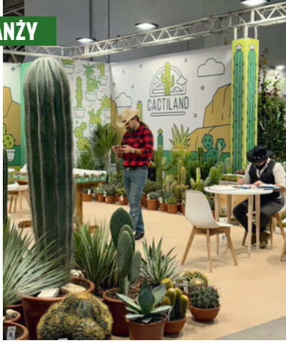
Fragment ekspozycji włoskiego przedsiębiorstwa Cactiland, dla którego ważną częścią prezentacji była też stylizacja jego przedstawicieli