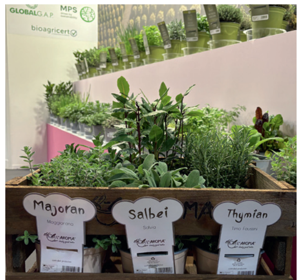
Ziola i rośliny aromatyczne ze stoiska przedsiębiorstwa Consorzio RB Plant di Bruzzone, które posiada szereg certyfikatów poświadczających uprawę roślin przyjazną środowisku

rejonem produkcji roślin, takich jak: kaktusy i inne sukulenty (na kilku stoiskach specjalnie wyeksponowane), cytryny (i pokrewne im gatunki) w doniczkach o różnych rozmiarach, ziola, bugenwille – niekiedy bardzo okazałe,