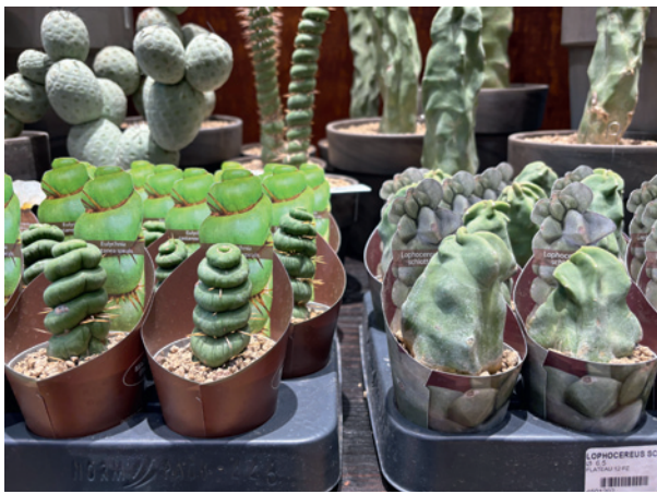
Eulychnia castanea 'Varispiralis' oraz Lophocereus schottii (Giromagi)

linia poświęcona gatunkom miododajnym czy też odmianom malin o różnobarwnych owocach – czerwonych, żółtych, czarnych.