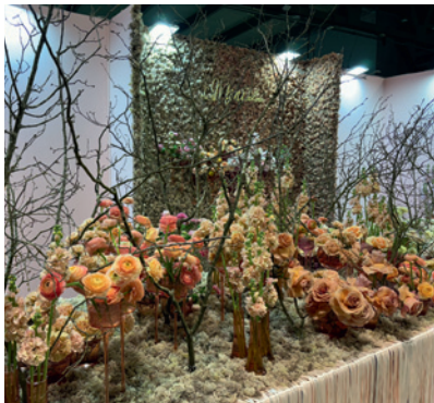
Na ekspozycji włoskiej szkoły florystycznej Le Mani Parlano dominował „Kolor Roku 2024”