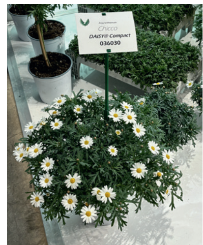
Argyanthemum Chicco z serii Daisy® Compact – nowość z asortymentu tej firmy