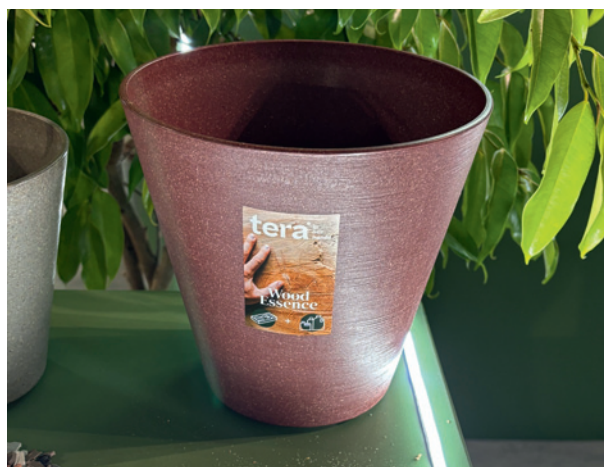
Doniczki i osłonki z serii „Wood Essence”, w których zawartość plastiku zmniejszono na rzecz drewnianych wiórów dodanych do tworzywa sztucznego

Jeśli chodzi o asortyment roślin, proponowano zestawy sukulentów odpornych na suszę, upał, skwar. Zwracano także uwagę na „zielone” rośliny pokojowe jako nieodzowne elementy każdego wnętrza (były różne propozycje dopasowane do warunków świetlnych).