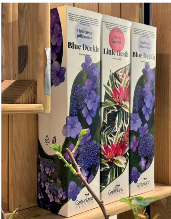
Opakowania charakterystyczne dla roślin kierowanych przez tę firmę do marketów (tu: nowa linia pudełek – dla krzewów „japońskich”)

Produkty te należą do czterech podstawowych kategorii: krzewy ozdobne (i byliny), krzewy owocowe, drzewka owocowe, róże. Na ekspozycji firmy Gartenland zwracały uwagę poręczne i wabiące wzrok kartoniki z roślinami (z zabalotowanym systemem korzeniowym), szczególnie