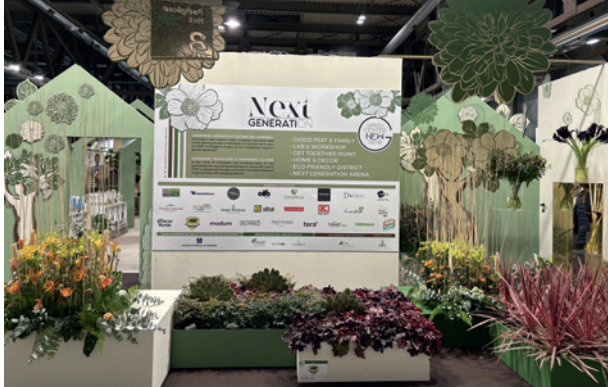
Sektor pod nazwą „Garden Center New Trend” na targach Myplant & Garden 2024, z ciekawą oprawą graficzną i stylistyczną