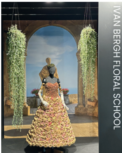
Praca szkoły florystycznej Ivana Bergha – z suknią utkaną z kwiatów jaskrów, eustomy, chryzantem