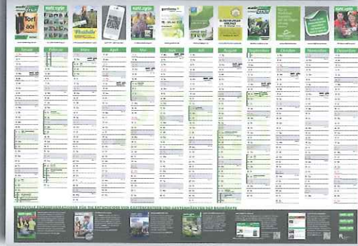
Neu! Wandkalender 2015