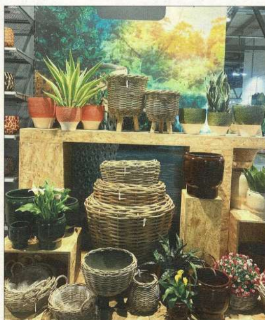
Große Auswahl an Kübeln.