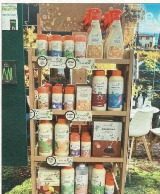
Angebot an Düngern und Bodenhilfsstoffen wächst.