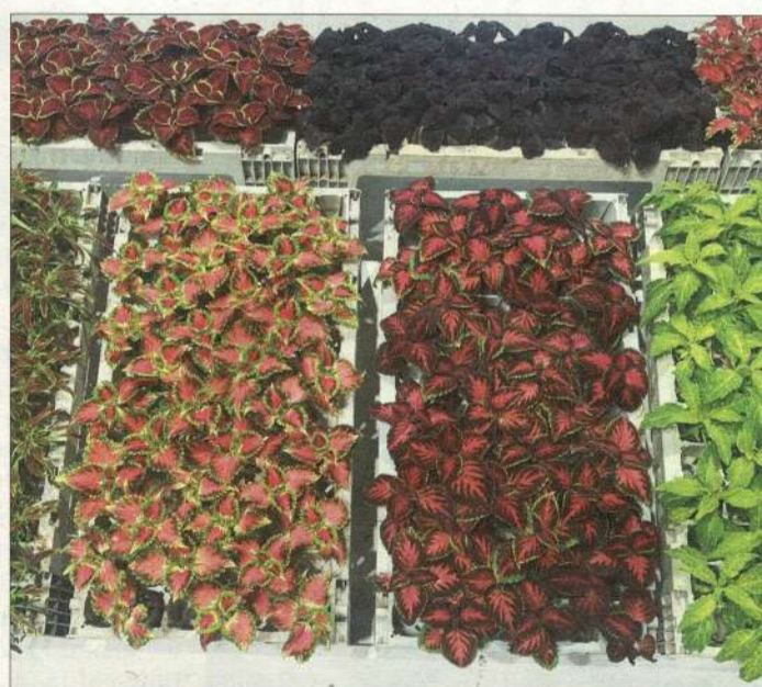
Ein breites Sortiment an Jungpflanzen gehört dazu.

I-Mailand. Die italienische Produktion meldet neue Rekordwerte. Insgesamt umfasste die Gartenbauproduktion 3,25 Milliarden Euro, was einem Anstieg von 3,5 Prozent gegenüber 2023 entspricht. Welche Faktoren treiben dieses Wachstum an und wie positioniert sich die Exportmesse in Mailand?