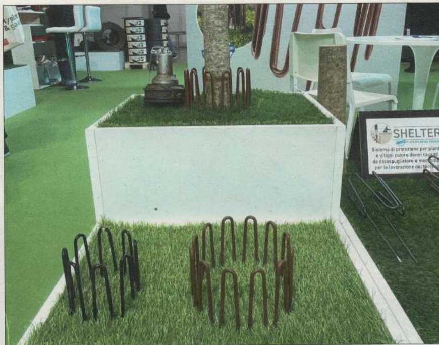
Auch zum Stammschutz gab es eine große Auswahl.

Italien ist im Bereich Gartenbau ein Nettoexporteur mit positivem Handelsbilanzüberschuss von 374 Millionen Euro: Exporten im Wert von 1,2 Milliarden Euro (plus 6,3 Prozent), stehen Importe in Höhe von 888 Millionen Euro gegenüber. Die wichtigsten Exportmärkte bleiben Frankreich, die Niederlande, Deutschland, die Schweiz und das Vereinigte Königreich. Große Märkte für Pflanzen aus Italien liegen auch in Afrika und im Orient.