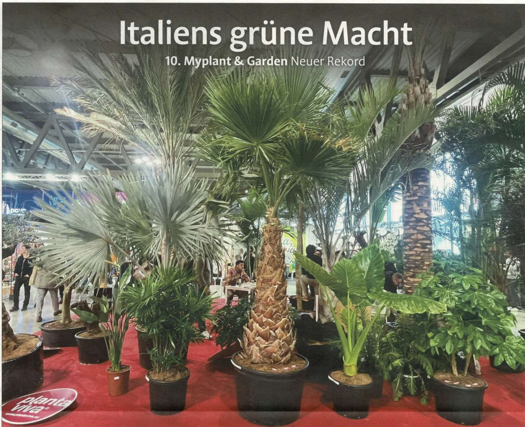
Solitiergehölze – auch deutlich südlicher Prägung – auf der Myplant & Garden in Mailand.