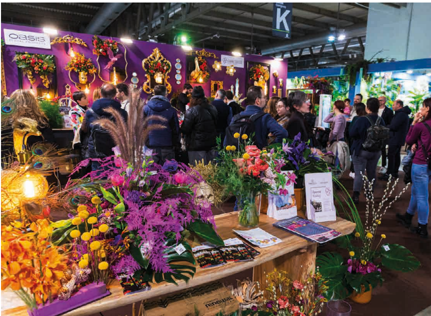
Ambiente de actividad y networking durante la décima edición de Myplant & Garden 2026.

crecimiento del 3,5% respecto al año anterior y más del 30% en la última década. Las exportaciones italianas de plantas y flores alcanzaron los 1.300 millones de euros en 2025, marcando un récord histórico y consolidando el prestigio internacional del "Made in Italy".