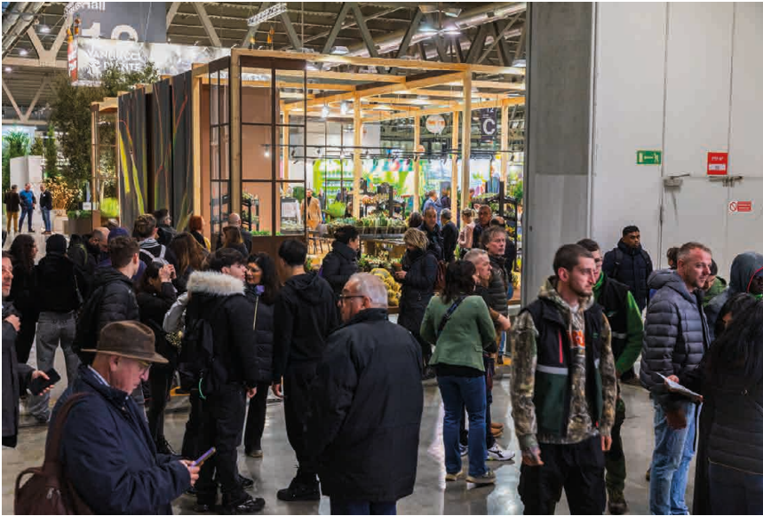
Profesionales del sector floroviverista durante la feria internacional en Milán.