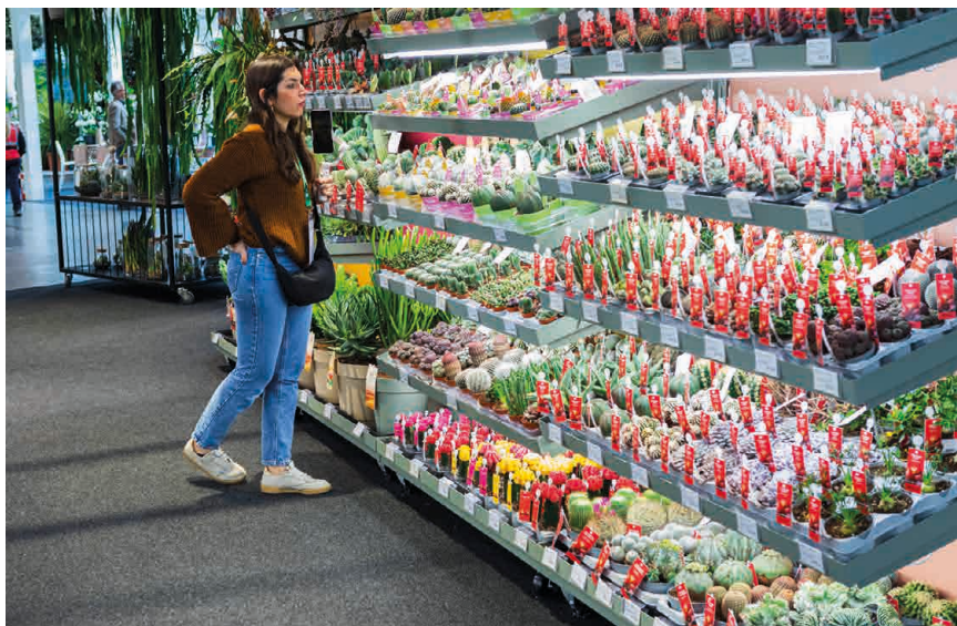
Presentación de nuevas tendencias en plantas de interior, incluyendo Ficus, Alocasia, Calathea y filodendros variegados de alto impacto visual.

décima edición es un profundo y sincero agradecimiento a quienes continúan aportando y haciendo crecer este espléndido edificio”.