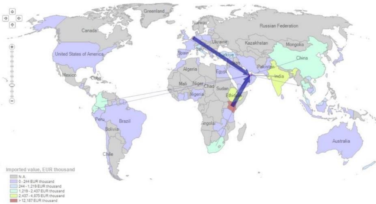
Tabla de flujos de importación de plantas en los Emiratos Árabes Unidos en 2023, en valor (en 000 $)

List of supplying markets for a product imported by United Arab Emirates in 2022 Product : 0603 Cut flowers and flower buds of a kind suitable for bouquets or for ornamental purposes, fresh, dried, dyed, bleached, impregnated or otherwise prepared