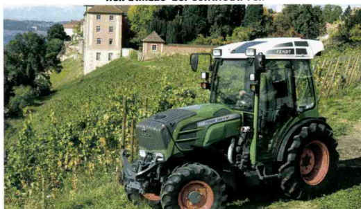
La Provincia autonoma di Bolzano è la più efficiente nell'utilizzo dei contributi Psr.

Tra i più ligi, in testa c'è la Provincia Autonoma di Bolzano capace di spendere da sola il 14,9 per cento del totale nazionale. Ci sono altri otto Enti (Veneto, Provincia Autonoma di Trento, Sardegna, Umbria, Calabria, Sicilia, Lombardia e Basilicata) che comunque presentano percentuali di spesa superiori alla media italiana. La maglia nera (chi l'avrebbe mai detto?) va alla Valle d'Aosta e al Friuli Venezia Giulia, con percentuali inferiori addirittura all'1 per cento. Ivan Poli